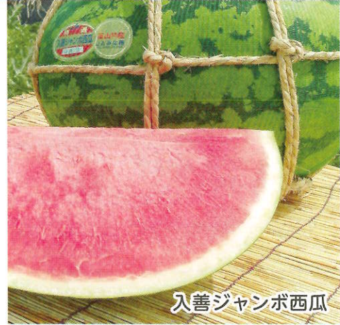
入善ジャンボ西瓜