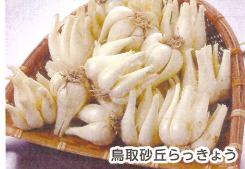
鳥取砂丘らっきょう