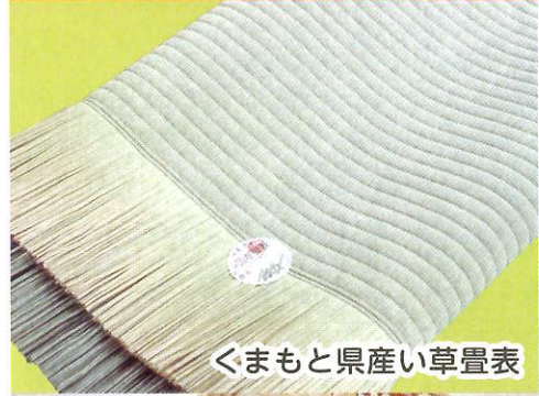
くまもと県産い草畳表