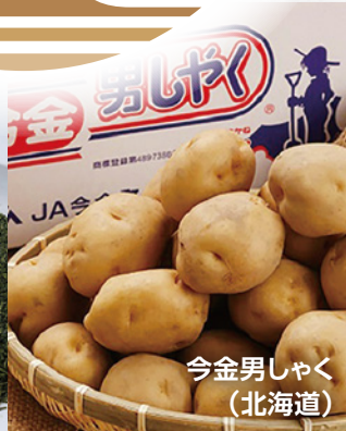
今金男しゃく (北海道)