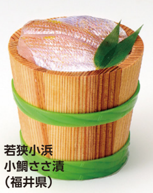
若狭小浜 小鯛ささ漬 (福井県)