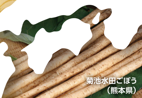
菊池水田ごぼう (熊本県)