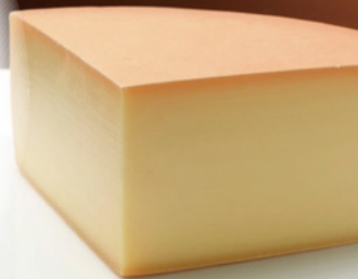
十勝ラクレット (北海道)