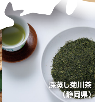
深蒸し菊川茶 (静岡県)