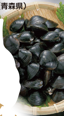
十三湖産 大和じじみ (青森県)