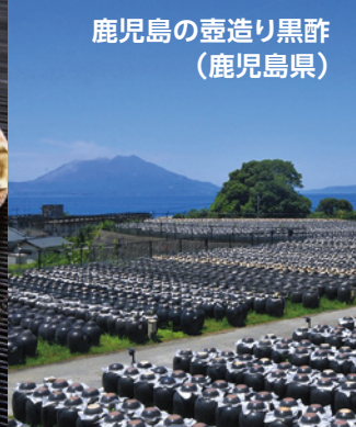
鹿児島壺造り黒酢 (鹿児島県)