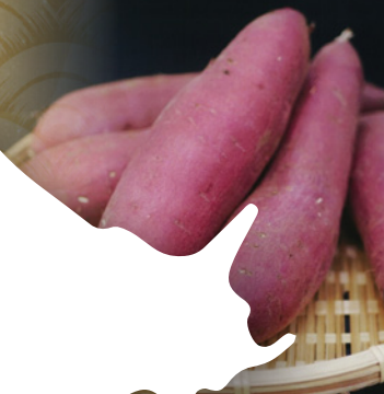
行方かんしょ (茨城県)