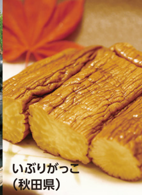
いぶりがっこ (秋田県)