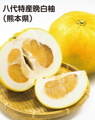
八代特産晩白柚 (熊本県)